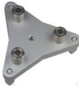
Base nivelante grande con imanes