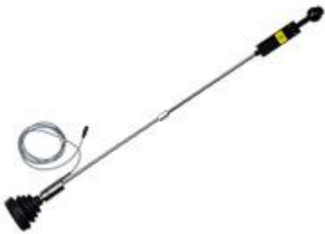
Sonda de suelo H2