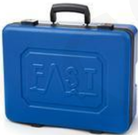
Maletín de transporte