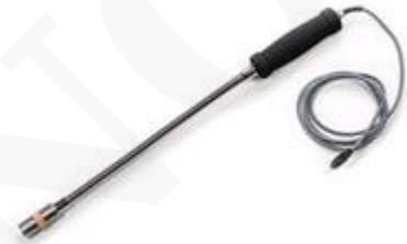
Sonda de mano H2