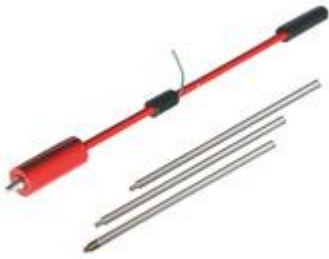
Varilla de prueba con extensiones Geófono con protección contra el viento Sensor universal con asa