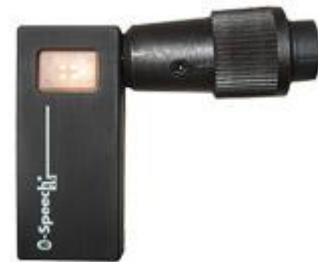
Llave de hardware Bluetooth para PipeMic