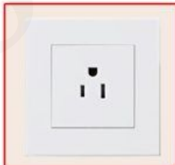
American standard socket