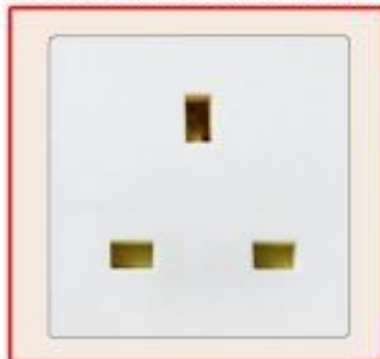
British standard socket