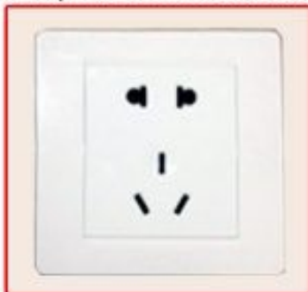
Chinese standard socket