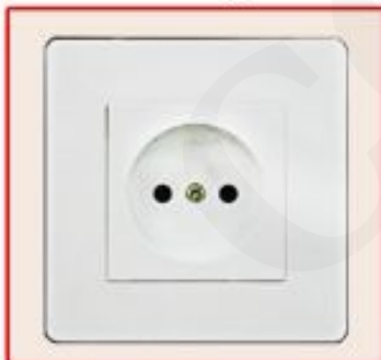
European standard socket