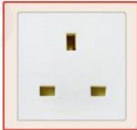
British standard socket