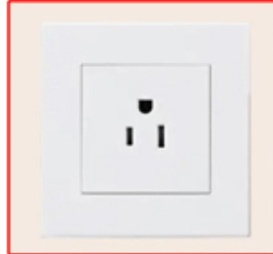
American standard socket