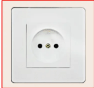
European standard socket