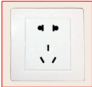
Chinese standard socket