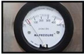
High efficiency differential pressure gauge