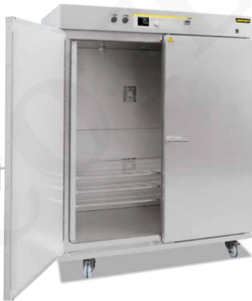
Estufa de secado TR 1050 con puerta de dos hojas