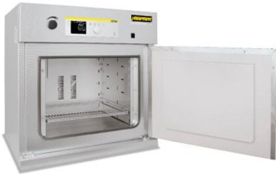
Estufa de secado TR 240