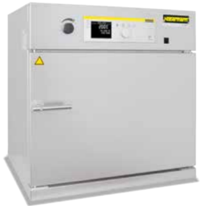
Estufa de secado TR 60 con velocidad ajustable del ventilador