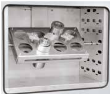
Dispositivo de giro eléctrico como equipamiento opcional