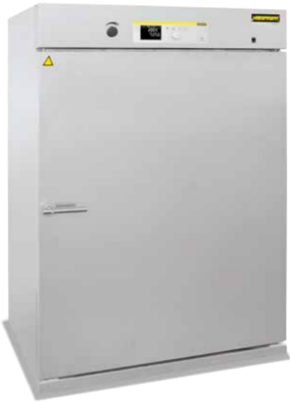
Estufa de secado TR 450