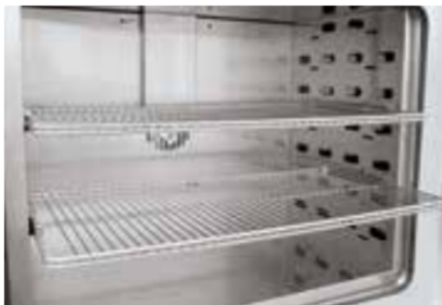
Rejillas extraíbles para cargar el armario secador en diferentes niveles