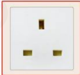
British standard socket