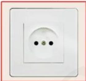
European standard socket