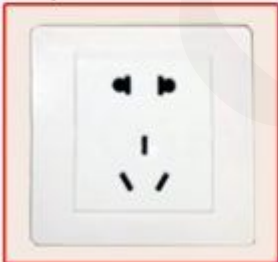
Chinese standard socket