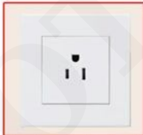
American standard socket