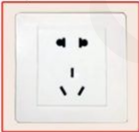
Chinese standard socket