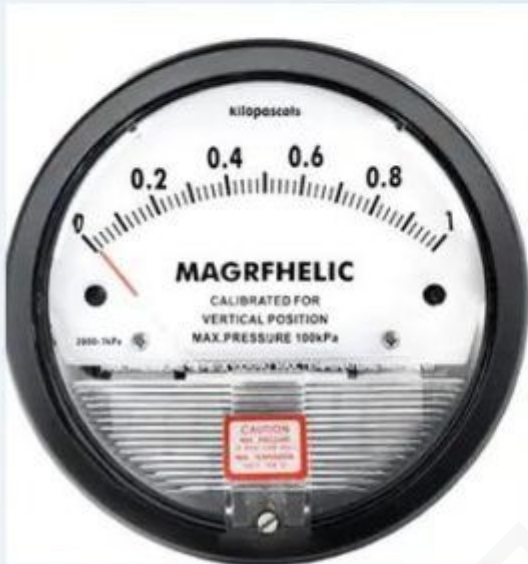
Differential pressure gauge