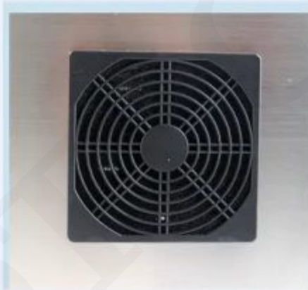
The cooling air inlet

Using general total insurance tube, to ensure safe operation of equipment as a whole, the international general supplies word socket, and appliances.