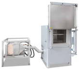
Horno de cámara con circulación de aire NA 120/45