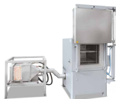
Horno de cámara con circulación de aire NA 120/45 con unidad de enfriamiento