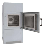
Horno de cámara con circulación de aire NA 500/45S, con cuatro

compartimentos equipados con rodillos y puertas individuales. Gracias a una precisa homogeneidad de la temperatura, estos hornos de cámara con circulación de aire son idóneos para procesos como el revenido, el temple, el endurecimiento, el recocido por disolución, el envejecimiento artificial, el precalentamiento y la soldadura. Los hornos de cámara con circulación de aire están equipados con las correspondientes cajas de recocido para procesos como el recocido blando de cobre, el temple de titanio o el revenido de acero bajo gas de protección no inflamable o reactivos. Debido a su estructura modular, los hornos con circulación de aire pueden adaptarse a las exigencias del proceso con accesorios funcionales.