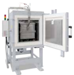
Horno de cámara con circulación de aire N 250/85 HA