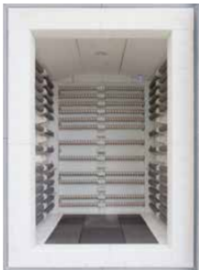
Horno de cámara N 650/14 BO con quemador de encendido

Los hornos de cámara de la serie N(B) .. BO se emplean para procesos con elevadas cantidades de sustancias orgánicas o elevadas cuotas de evaporación. Esta serie de hornos es adecuada para productos no sensibles a incrementos de temperatura temporales incontrolados. Con este horno de cámara también se pueden realizar, en condiciones seguras, los procesos en los que el producto o las impurezas se incineran a través de una inflamación. Ejemplos de ello son la eliminación de la cera de moldes de colada en racimo con posterior sinterización o la limpieza térmica de catalizadores de óxido de restos de hollín o de carburante. Los hornos de cámara se ofrecen con calentamiento eléctrico o calentamiento por gas. Por motivos de seguridad, los hornos con calentamiento eléctrico N ..BO son adecuados para procesos lentos con un control exacto de la temperatura y la precisión de la temperatura. Disponen de un quemador de gas integrado para inflamar los componentes inflamables en mezclas de gas. De esta forma se evita la acumulación de componentes inflamables garantizándose una combustión segura.