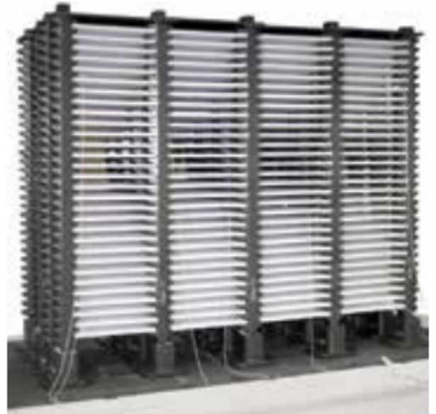
Horno de cámara para pequeños componentes cerámicos

Estos hornos de campana o hornos con elevador inferior especialmente diseñados para refrigerar estructuras complejas o trabajar el vidrio en caliente cuando lo requiere una parte del proceso como, por ejemplo, la soldadura en la construcción del vidrio. La campana de accionamiento electrohidráulico y apertura ancha permite una apertura en estado caliente y un