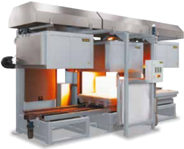
Horno de campana H 245/LTS con unidad refrigeradora y dispositivo de intercambio de mesas