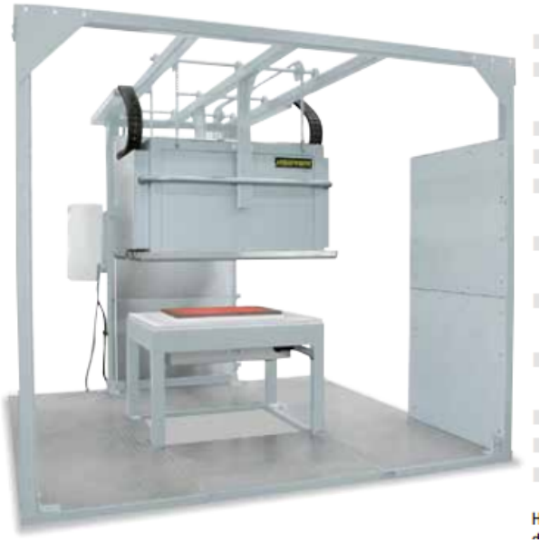
Horno de campana H 240/S. Mesa accesible desde los cuatro lados para soldar construcciones de vidrio de cuarzo con movilidad vertical y horizontal de la cúpula