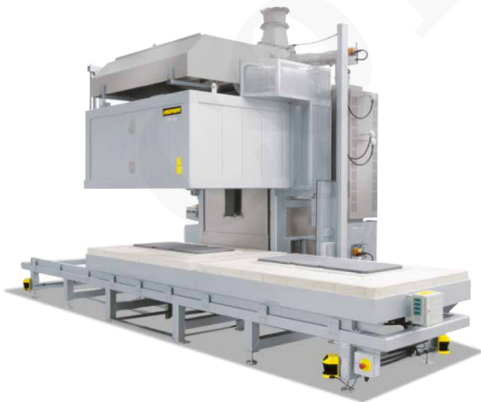
Horno de campana H 500 DB200 con instalación de postcombustión catalítica, sistema automático de cambio de mesa y escáneres de seguridad para proteger la zona de peligro