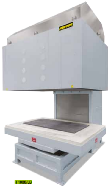
Horno con elevador inferior H 1000/LB