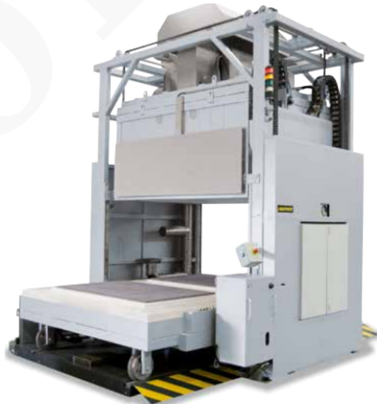
Horno de campana H 1600/14 DB 200