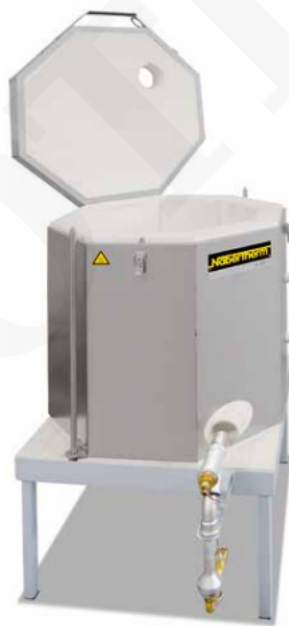
de pie con mecanismo de manivel