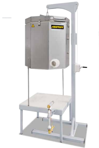
Horno Rakú 100 con quemador de gas y el levantamiento