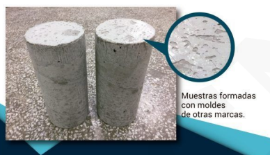
Muestras formadas con moldes de otras marcas.