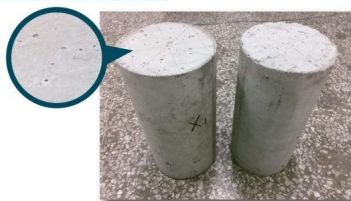
Muestras formadas por nuestros moldes de hierro fundido .