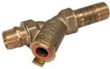
Conexión Y 45°, 190 mm, apropiado para montar en lugar del contador