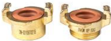
Acople GK con rosca interior y exterior