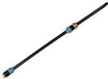
Guía de inserción