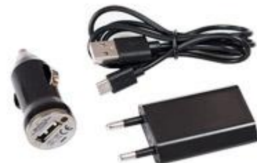
Accesorios de carga