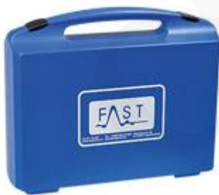
Maletín de accesorios