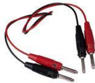
Cable de conexión entre el PipeMic y el detector de tuberías