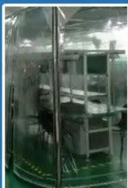
Clean laminar flow zone