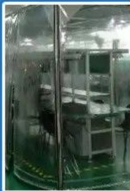
Clean laminar flow zone